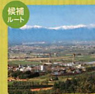
候補ルート トカプチ雄大空間 Tokapuchi Yuudaikuukan