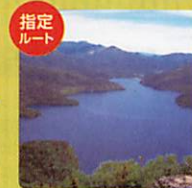
指定ルート 十勝平野・山麓ルート Tokachiheiya Sanroku Route