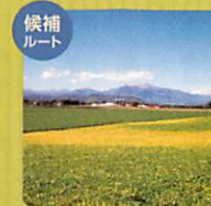
候補ルート 南十勝夢街道 Minami Tokachi Yumekaido