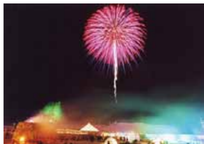
▲前日の夜には花火が上がりました。