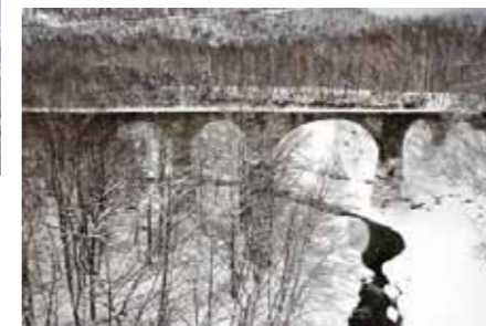
(上)109m8連の大迫力のアーチ第五音更川橋梁 (左)冬の時期に見ることができる第四音更川橋梁