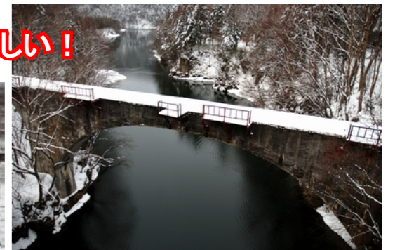
▲ダム湖にかかるアーチが美しい第三音更川橋梁