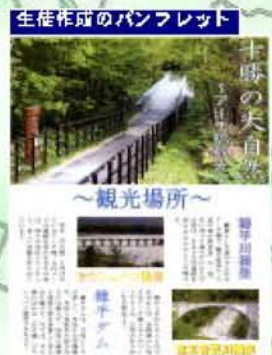
生徒作成のパンフレット