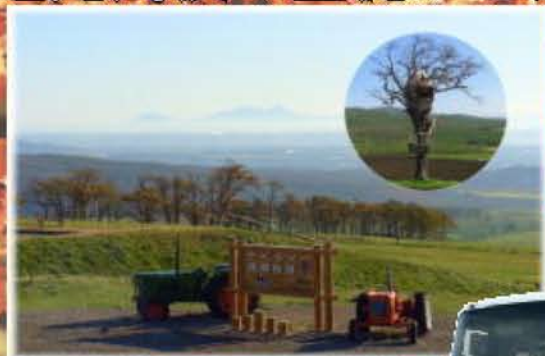
紅葉めぐり 糠平温泉めぐり