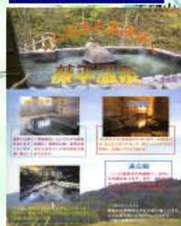
生徒作成のパンフレット