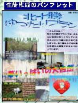
生徒作成のパンフレット